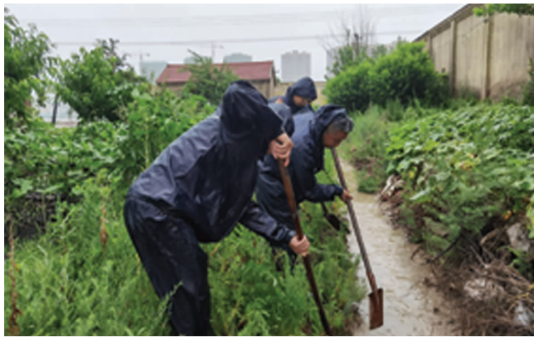
暴雨凶猛,“烟花”肆虐,港城这几天出现强降雨和大风天气,台北投资公司,通过组建防汛抢险队,强化应急值班值守,突击防汛作业等多项举措,全力做好防汛工作,保住“劳动果实”。图为员工正在疏通排淡沟道。(韩挺)

仓储中心小包装班共有4个师傅,平均年龄51岁,面庞被风吹日晒黝黑而粗糙。他们负责的工作繁多,包括包装桶装氯化苯、装卸原辅料备品备件、转运原辅料、清洗转运苯甲醛包装桶、桶装成品装车等,每一件工作他们都力争做到最好。在这炎炎夏日,氯化苯包装车间内非常闷热,小包装的师傅们每天都要在这里工作近6个小时。上桶、放料、盖上桶盖和保险盖、叉车运走待检。在苯甲醛空桶的清洗场地上,师傅们正在取桶、开桶盖、回抽桶内物料、检查、拧上桶盖、堆码。清洗场地缺少遮挡,工作不到一会就汗流浹背,身上的工作服找不到一块干燥的地方。他们却说,我们只是干好自己的份内工作,不辛苦的。(顾孟 徐洁 卞绍娟 江超)