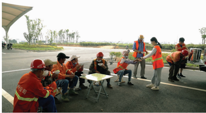
连日来,徐圩投资公司开展“流动茶馆”送清凉行动,由徐圩悦升公司食堂熬制清凉解暑的绿豆汤和茶叶水,通过生产巡查车辆送至保洁、绿化、市政等生产一线各个班组、岗位,突击点,一碗碗爽口的绿豆水、茶叶水为炎炎夏日坚守在一线的职工送去“清凉”与问候。(悦宣)

降低职工劳动负荷。公司工会与各车间单位强化沟通交流,合理调整加工盐、雪花盐、品种盐生产及装卸等岗位职工的劳动作业时间,避开高温时段作业,让职工劳逸结合。各基层分会组织开展技术革新、小改小革,对生产工艺进行优化,提升工作效率,降低劳动强度。(金工)