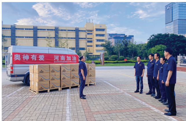
7 月 20 日，河南郑州全市普降大暴雨并引发洪灾。在得知灾情后，7 月 22 日，氨纶公司第一时间筹备好抗菌、驱蚊等功能性服装物资送往灾区，并积极参加当地志愿服务。（氨纶宣）

地、水面等资源效益，发包流程更加成熟、完善。各类应收租金 9135.32 万元（已签合同），已收租金 6509.33 万元。全年应收池塘承包费 3892.03 万元，在比去年同期减少 4000 余亩的情况下，净增 58.25 万元。平均单价 1227.91 元/亩，同比提高 120.78 元/亩。其中到期池塘 6718 亩，通过公开竞价，均价达 1950 元/亩。农田对外租赁 8634.54 亩，收费 862.55 万元，平均单价 850.14 元/亩，同比提高 171.26 元/亩。自种水稻 1220 余亩。收取管委会土地租赁费 1526.19 万元。“开山岛”大米销售 8 万余斤，创效 15 万元。（西宣）