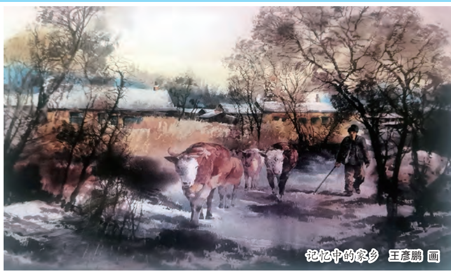
记忆中的家乡 王彦鹏画