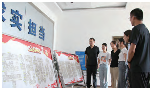
“七一”期间,青口投资公司党委开展了“红色誓言守初心”感恩寄语征集活动,共收到来自各条战线、各个岗位的党员干部祝福寄语近百条,进一步增强广大党员的光荣感、使命感,激励广大党员学贯二十大、建功新青口。(仲伟彬)

抓牢学贯“不务虚”,凝聚奋进向心力。开展“学贯二十大·书香润初心”读书活动,组织全体党员、入党积极分子、管理人员精读《图解二十大精神》,撰写心得体会;举办“党的二十大精神”知识抢答赛,参与区域党建联动共建活动,开展“创新创业强引领、开源节流做表率”党内主题教育实践活动,引领党员直面风险挑战,乘势而上开新局。(刘媛媛)