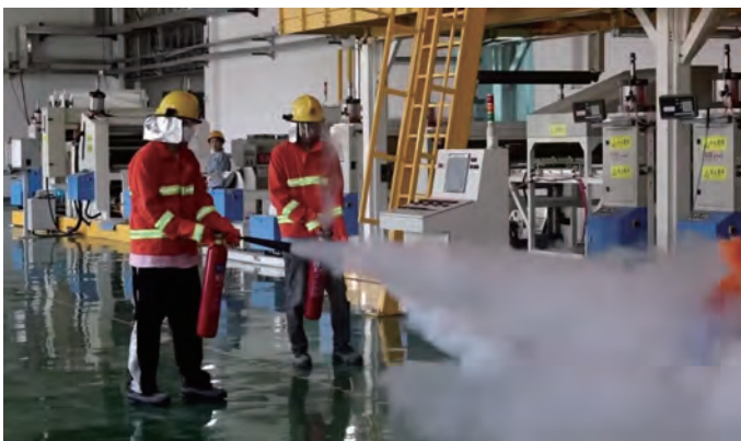
近日,纤维新材料研究院组织全体干部职工开展应急疏散消防演练,进一步增强职工的消防意识,提升消防管控水平,构筑消防安全屏障。(邵波)

送法律。针对员工发生高温中暑危害开展夏季“防止中暑应急处理演练”。为生产车间赠送《安全生产法》《职业病防治法》《劳动防护用品》等安全生产相关法律、法规宣传资料,引导广大员工提高依法维护自身安全与健康权益的意识和能力。(韩奇)